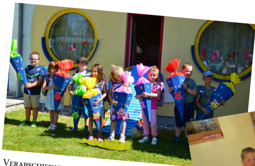
VERABSCHIEDUNGSFEIER DER SCHULANFÄNGER