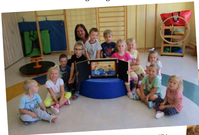
WIR HÖREN DAS KAMISHIBAI-ERZÄHLTHEATER: "MEIN TAG IM KINDERGARTEN."