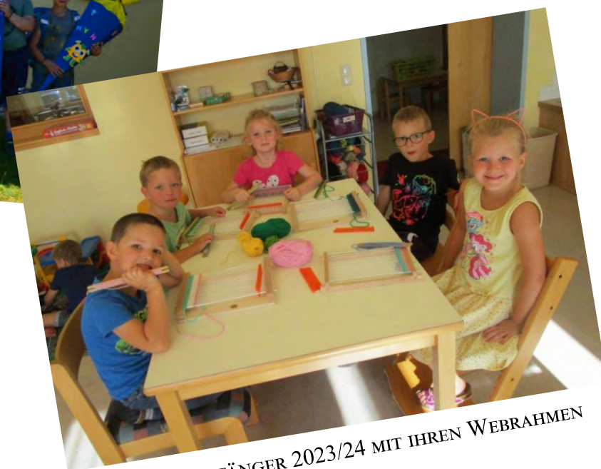
SCHULANFÄNGER 2023/24 MIT IHREN WEBRAHMEN