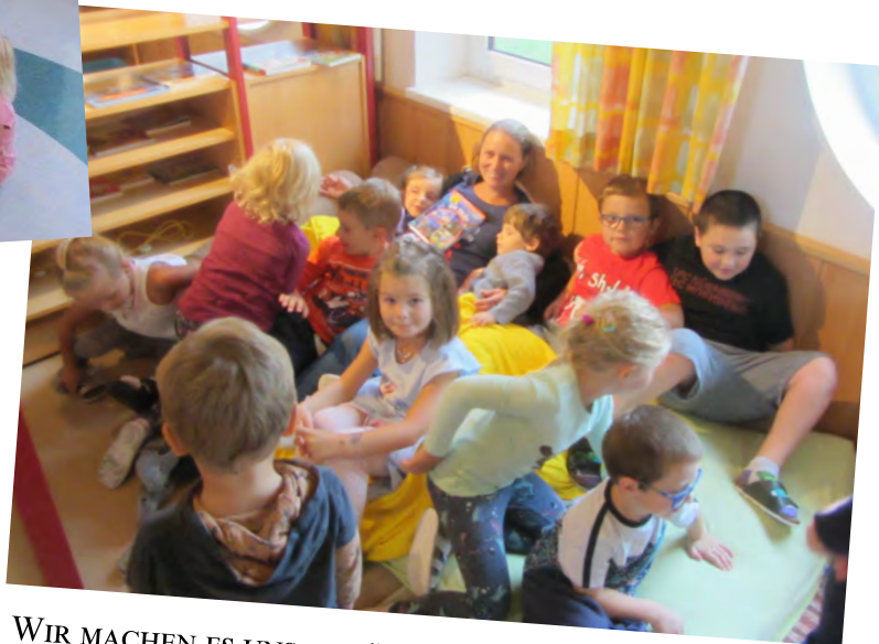
WIR MACHEN ES UNS GEMÜTLICH IN DER FERIENBETREUUNG