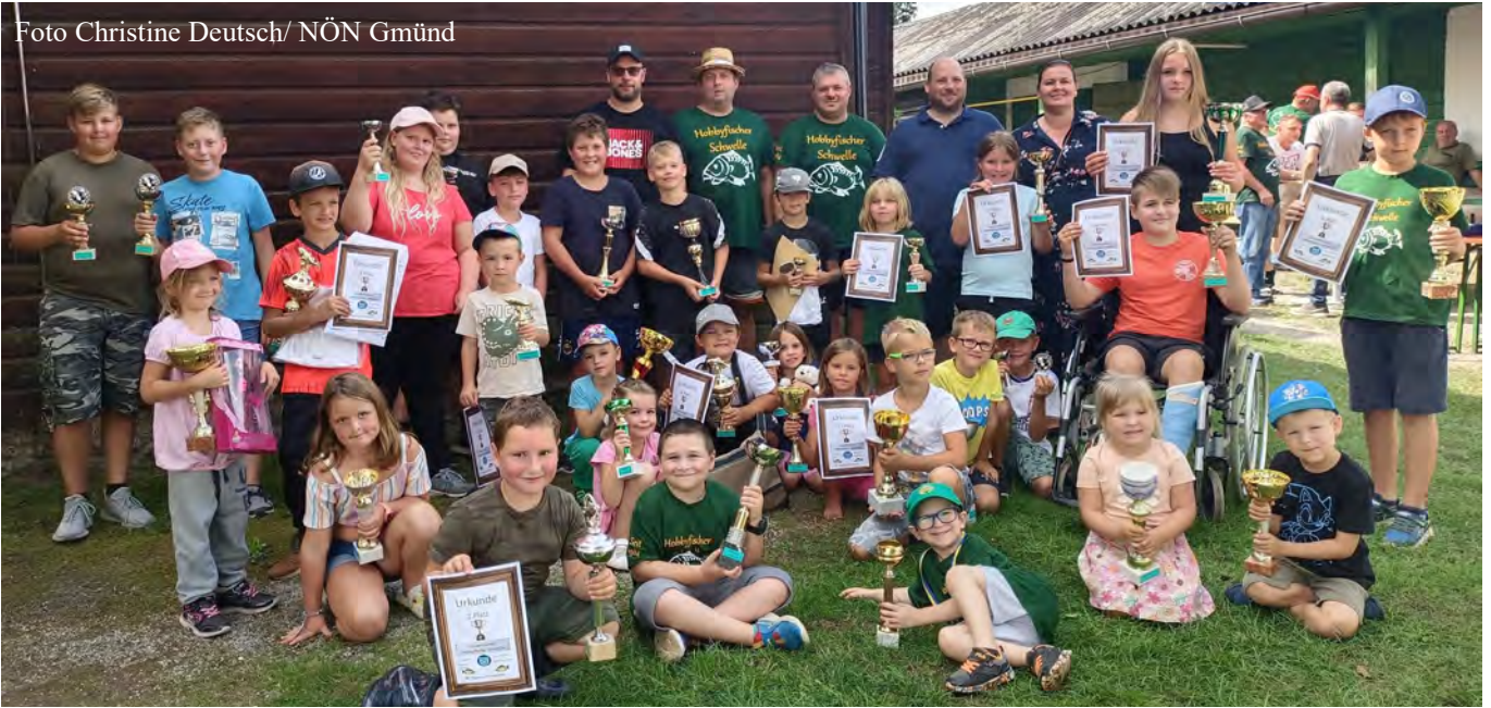
KINDERFISCHEN DER HOBBYFISCHER „SCHWELLE“